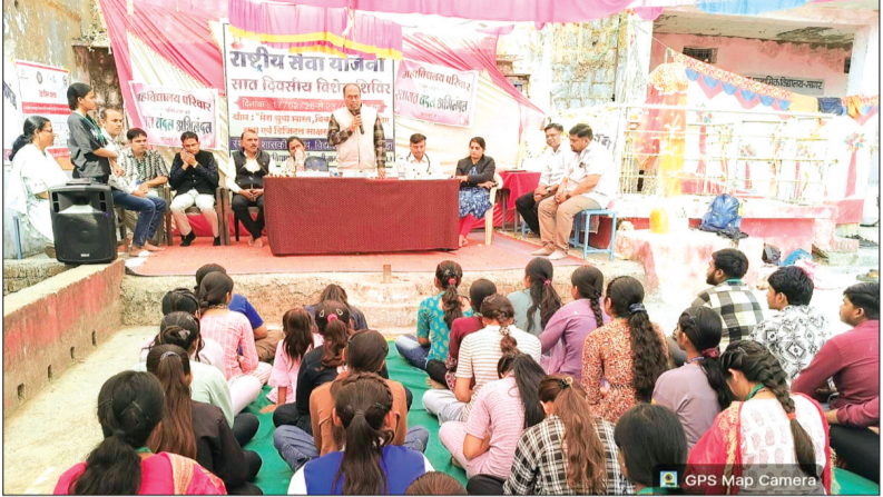
हरिभूमि न्यूज चंचौड़ा

शासकीय महाविद्यालय चाचौड़ा बीनागंज द्वारा सात दिवसीय विशेष शिविर गोदग्राम सागर में आयोजित किया जा रहा है जिसमें पंचम दिवस की शुरुआत स्वयंसेवकों द्वारा ग्राम में घर घर जाकर परियोजना कार्य किया गया। 'आज के कार्यक्रम के अवसर पर स्वास्थ्य केंद्र बीनागंज की टीम द्वारा स्वास्थ्य एवं रक्तदान शिविर का आयोजन किया गया। इस अवसर पर मुख्य