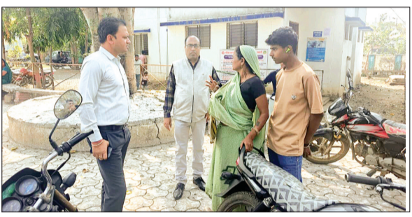
हरिभूमि न्यूज चंचौड़ा