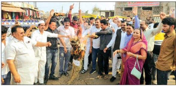
हरिभूमि न्यूज आरोन